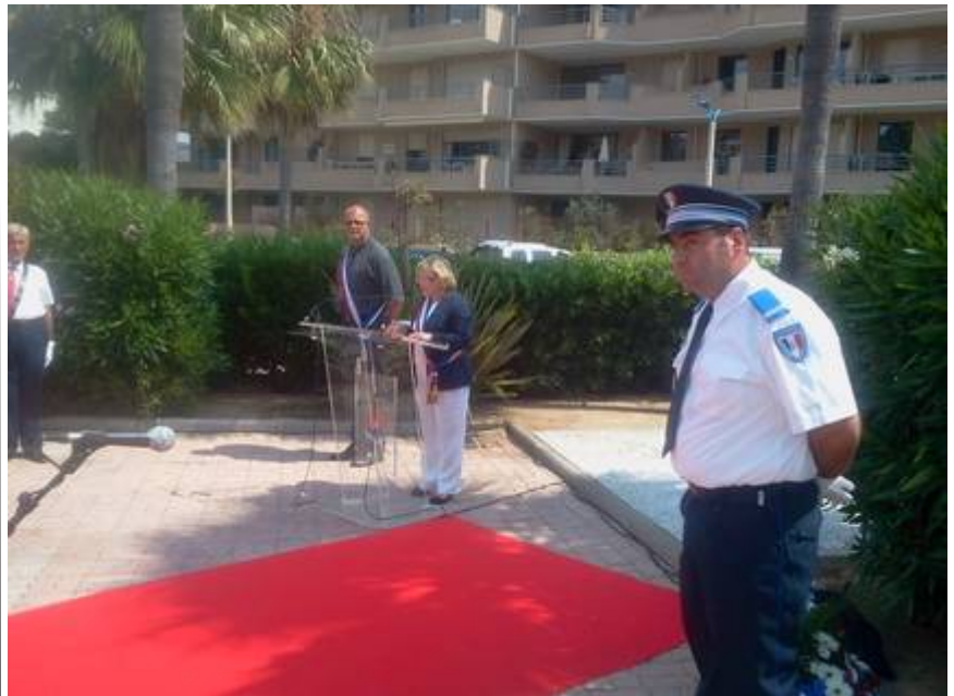
Discours de Madame le Maire, suivi de dépôts de gerbes