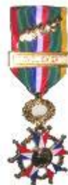
La Médaille du Civisme et Dévouement